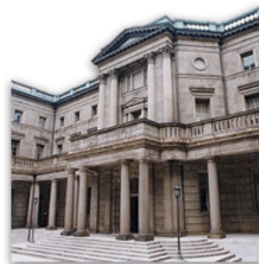
Κτίριο της Bank of Japan στο Τόκιο

Είναι μέσα Δεκεμβρίου 2002 και η άποψη πολλών αναλυτών, αλλά και της FED, φαίνεται πως αλλάζει αργά αλλά σταθερά. Από τον Οκτώβριο κιόλας πολλοί οικονομολόγοι μιλούν για αποπληθωρισμό στη Γερμανία. Τα πρακτικά της συνεδρίασης της FED (6 ης Νοεμβρίου) έκαναν εκτενή αναφορά στους φόβους για αποπληθωρισμό. Μερικές εβδομάδες αργότερα το νέο μέλος του Federal Open Market Committee (FOMC) Ben Bernanke, εν ονόματι της FED και του Greenspan υποθέτω, κήρυξε πόλεμο κατά του αποπληθωρισμού λέγοντας πως θα γίνουν τα αδύνατα δυνατά ώστε να μη συμβεί στις Η.Π.Α.. Στο 1 ο Μέρος και ειδικότερα στη σελίδα 2 είχα διερωτηθεί στον τίτλο: “Σημάδια Αποπληθωρισμού στις ΗΠΑ;”