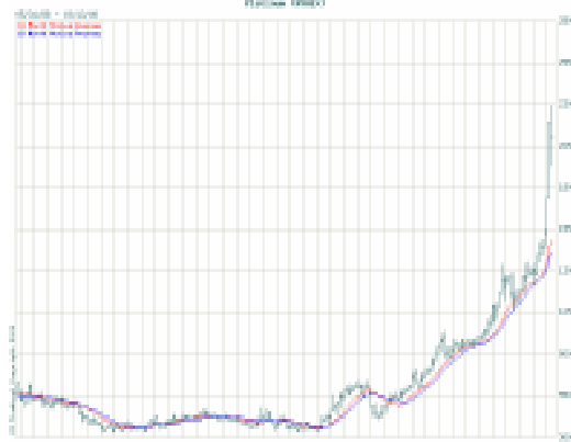
ΠΛΑΤΙΝΑ: ΜΗΝΙΑΙΑ ΤΙΜΗ ΔΙΑΠΡΑΓΜΑΤΕΥΣΗΣ (δολ. / ουγγιά) Περίοδος 31/05/1988 - 13/03/2008